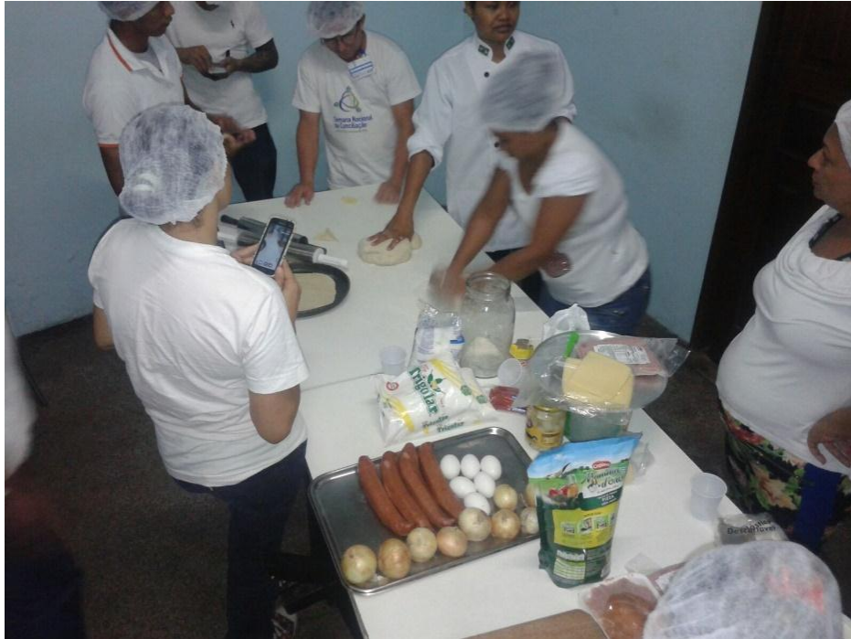
Curso: Auxiliar de cozinha