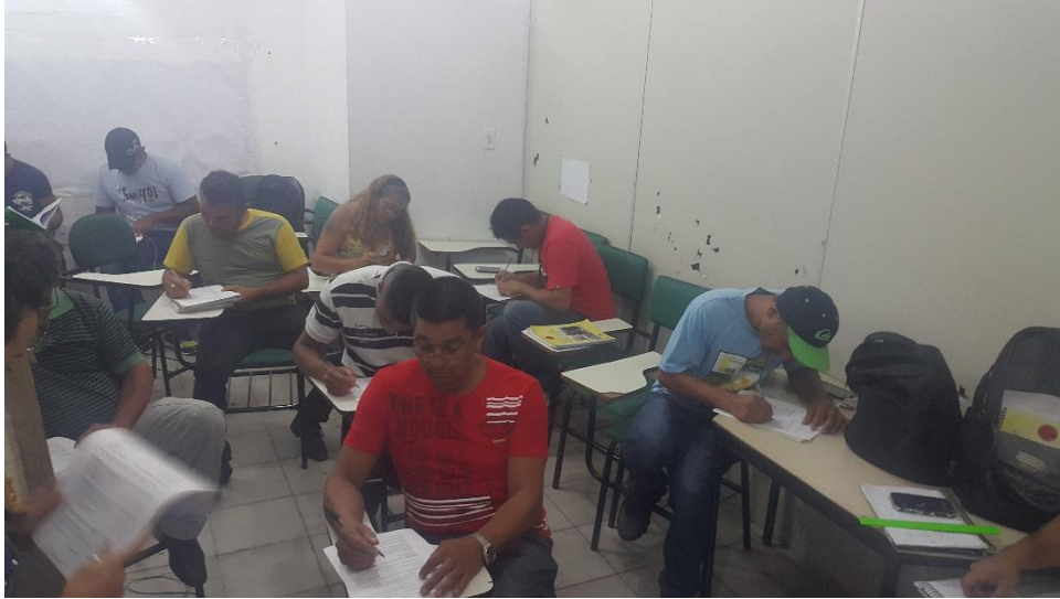
Curso: Instalador Elétrico