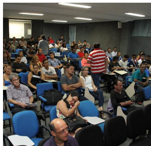
Certificação dos educandos