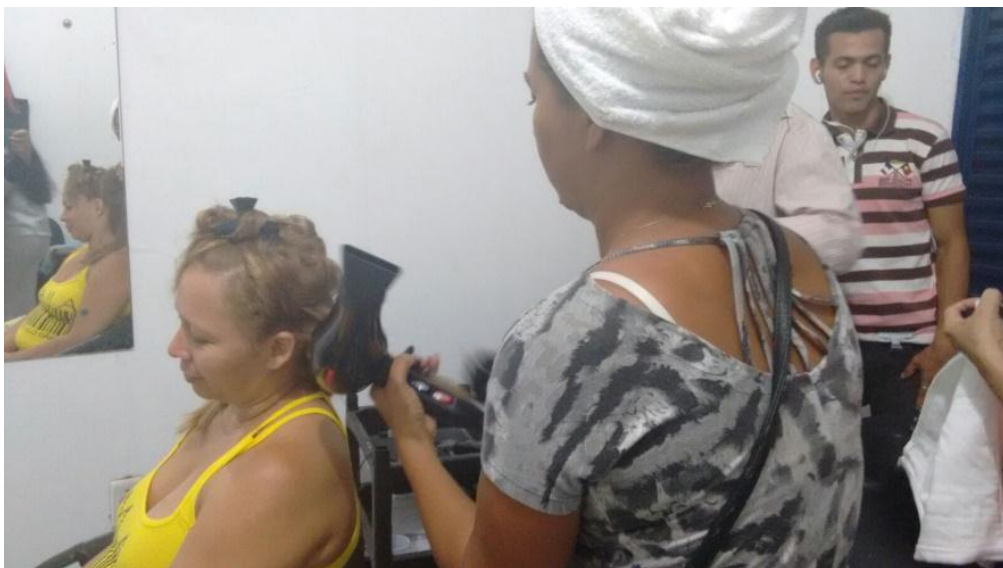
Curso: Auxiliar de Cabeleireiro