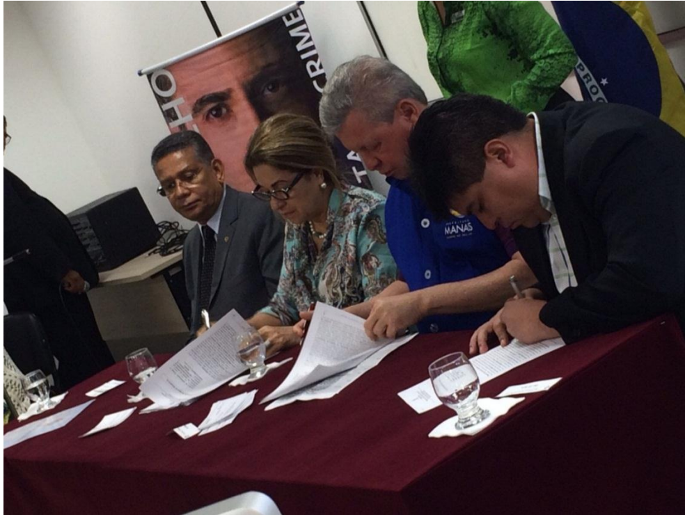
Assinatura do Termo de Cooperação Técnica entre Prefeitura de Manaus/SEMTRAD e Tribunal de Justiça