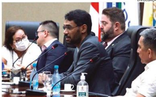
A ideia da Prefeitura é qualificar os permissionários

“A Semtepi, ao longo dos anos, tem tentado levar mais movimento às galerias, inclusive nós fomos o primeiro serviço público de balcão a voltar a atender o