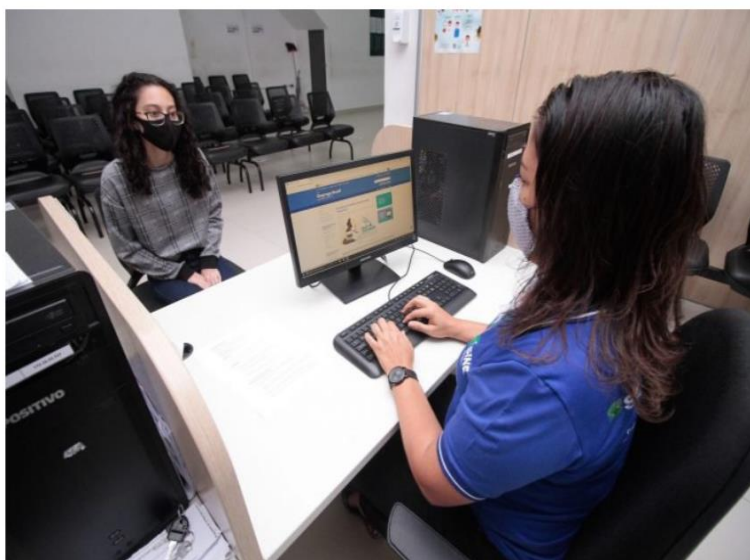
Sine Manaus oferta 270 vagas de emprego nesta sexta-feira, 23/9

Início / Economia / Sine Manaus oferta 270 vagas de emprego nesta sexta-feira, 23/9