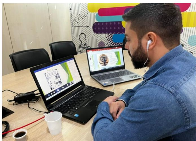
Projeto "Conexão de Aprendizagem: Visando Oportunidades"

Por Zukka Brasil | AM - 23 de setembro de 2022