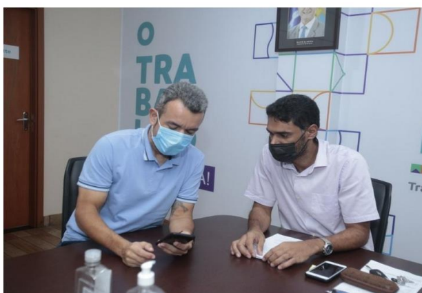
Ainda no mês de fevereiro, o texto final deve ser levado para discussão