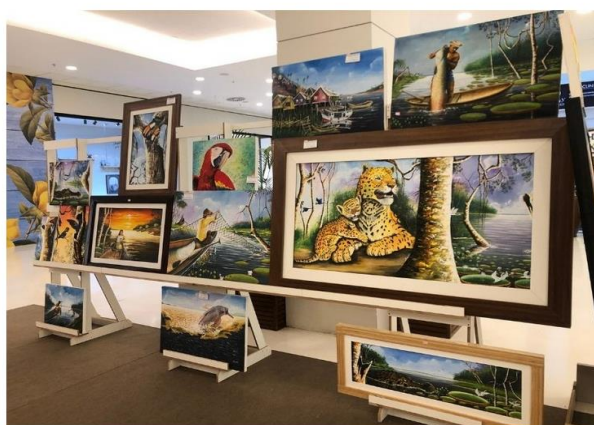
"Amazônia Viva" conta com mais de 30 telas assinadas por Amarildo Valle