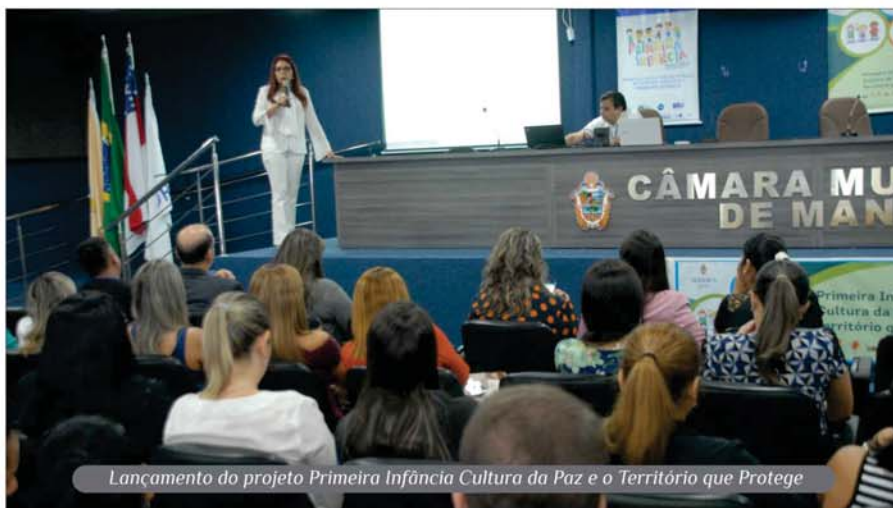
Lançamento do projeto Primeira Infância Cultura da Paz e o Território que Protege