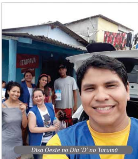
Disa Oeste no Dia 'D' no Tarumã