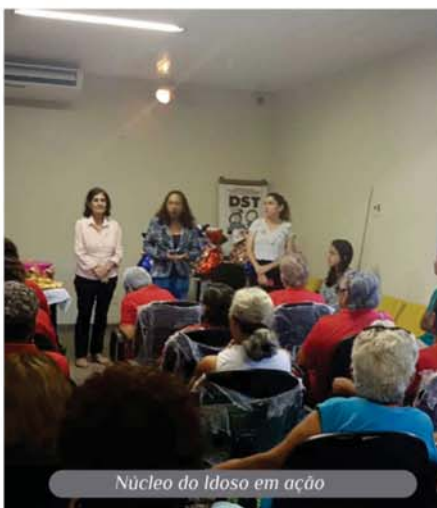
Núcleo do Idoso em ação