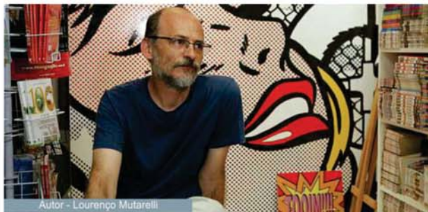
Autor - Lourenço Mutarelli