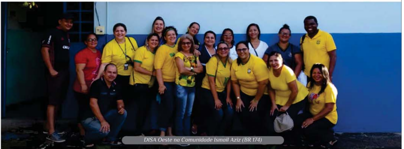
DISA Oeste na Comunidade Ismail Aziz (BR 174)