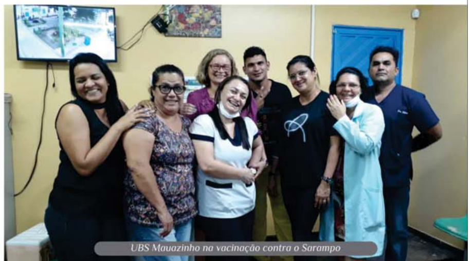
UBS Mauazinho na vacinação contra o Sarampo