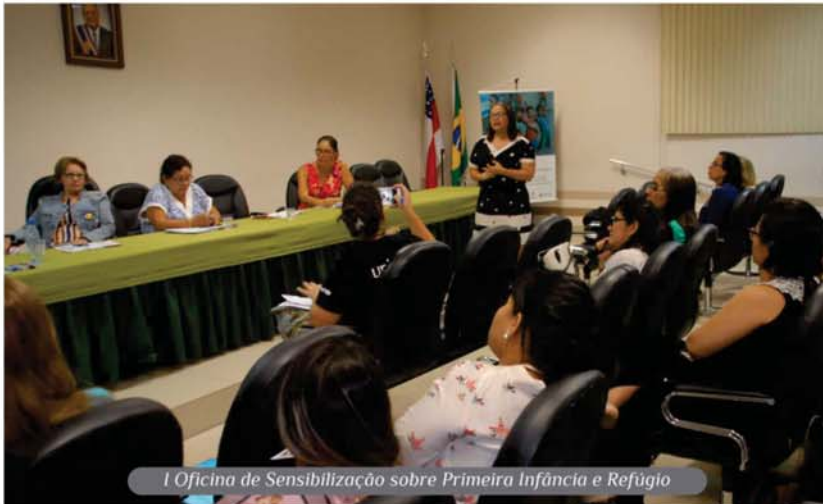
1 Oficina de Sensibilização sobre Primeira Infância e Refúgio

Resumo das atividades que marcaram o mês de junho.