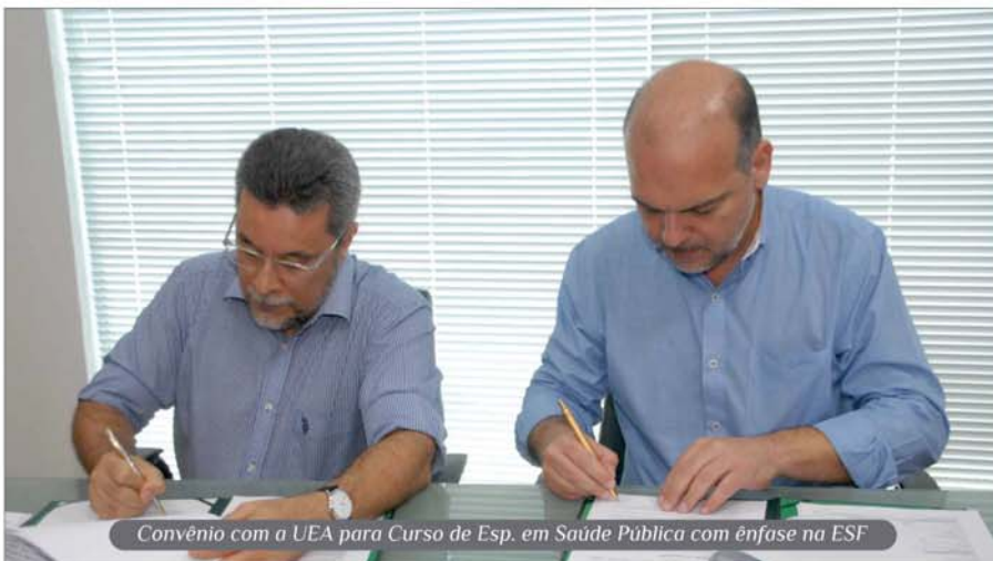
Convênio com a UEA para Curso de Esp. em Saúde Pública com ênfase na ESF

Resumo das atividades que marcaram o mês de junho.