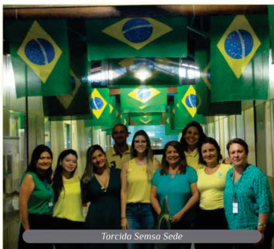
Torcida Semsas Sede