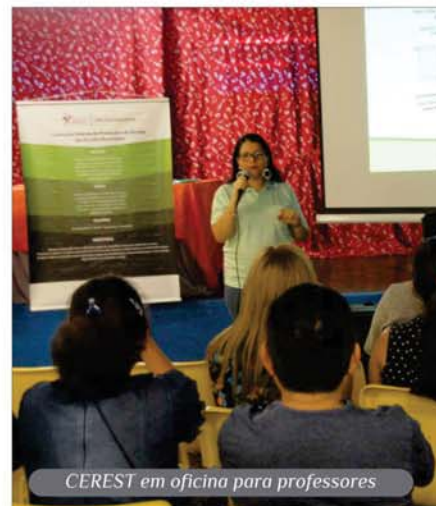
CEREST em oficina para professores