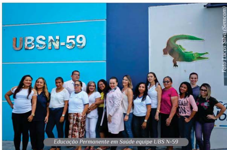
Educação Permanente em Saúde equipe UBS N-59