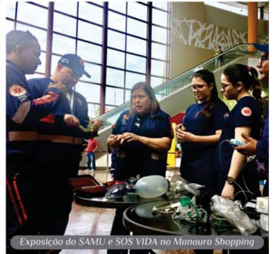
Exposição do SAMU e SOS VIDA no Manaura Shopping