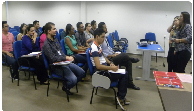
Servidores passaram por avaliação após o curso sobre Norma NBR

O setor de Assessoria Técnica, responsável pelo acompanhamento da atividade, explica que a ação objetiva atingir três pontos principais: qualificar Auditores Internos da Qualidade, reforçando os conceitos, fundamentos e princípios do Sistema de Gestão da Qualidade e apresentar os processos e técnicas relacionados à auditoria; preparar os participantes para usar a auditoria como uma ferramenta gerencial na Gestão do Sistema da Qualidade e