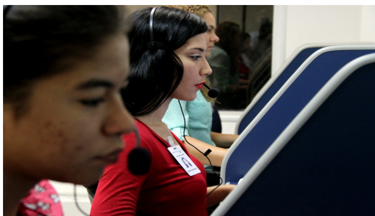
Call center funciona de segunda a sexta, em horário integral

acumulavam essa tarefa, agora se dedicam integralmente aos aposentados e pensionistas que precisam de atendimento presencial para resolver suas pendências. Antes do call center , os atendentes do Sate tinham que pausar o atendimento presencial para atender ao segurado que estava ligando, gerando, muitas vezes, inquietação de quem havia se deslocado até o órgão.