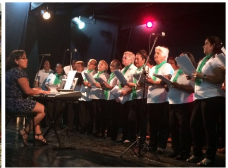
Exercitar a mente é a proposta da Oficina da Memória. Nas aulas de artesanato e canto, lazer auxilia na harmonia interior