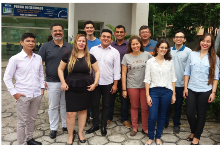
Os novos servidores que compõem a terceira turma de convocados