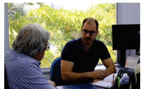
Te cnologia da Informação