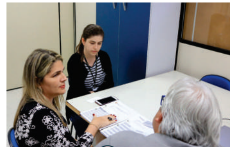
Co ncessão de benefícios