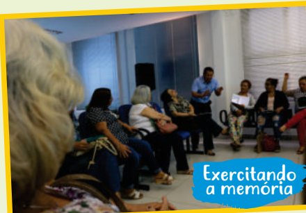
Exercitando a memória