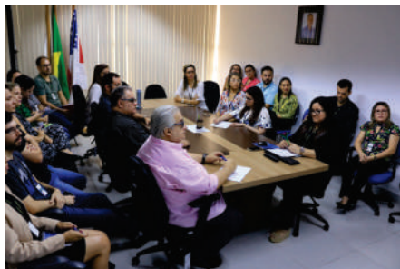
Abertura dos trabalhos