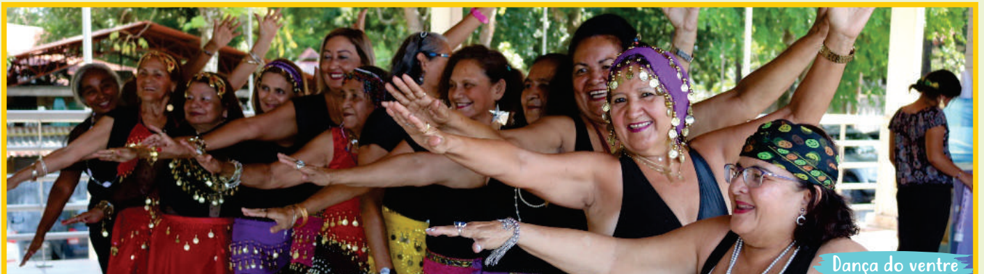
Dança do ventre