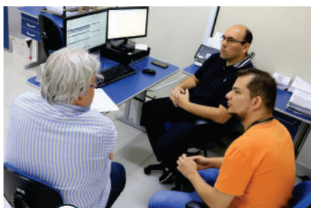
Su perintendência de investimentos

▼ A previdência de Manaus recebeu a recomendação da manutenção da certificação ISO 9001 - Sistema de Gestão da Qualidade, no escopo "Concessão de Benefícios (Aposentadorias e Pensões), com transição aprovada para a versão 2015, a mais recente do sistema. A conquista aconteceu após auditoria externa da empresa TÜV Rheinland, em agosto. O resultado é mais um reconhecimento da gestão da qualidade que existe na previdência municipal desde 2013, voltado para os segurados ativos, inativos e pensionistas.