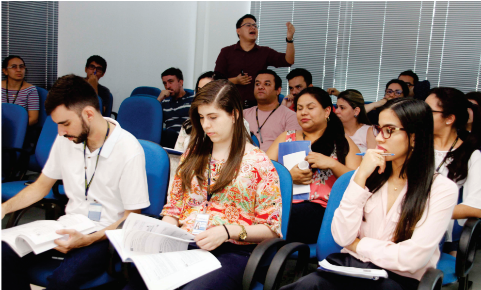
Servidores durante curso de "Formação de Auditores Internos da Qualidade"

As normas ISO são avaliadas e atualizadas a cada cinco anos