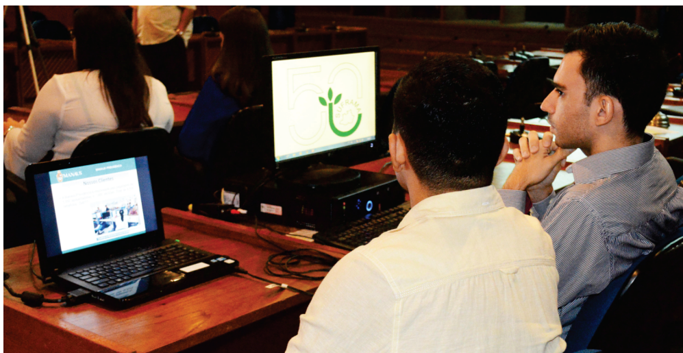
Exposição da Manaus Previdência durante a 18ª Mostra de Gestão do PQA

Autarquia concorre em Programa de Qualidade da Fieam e impressiona pela boa governança