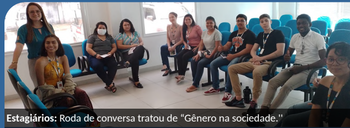
Estagiários: Roda de conversa tratou de “Gênero na sociedade.”