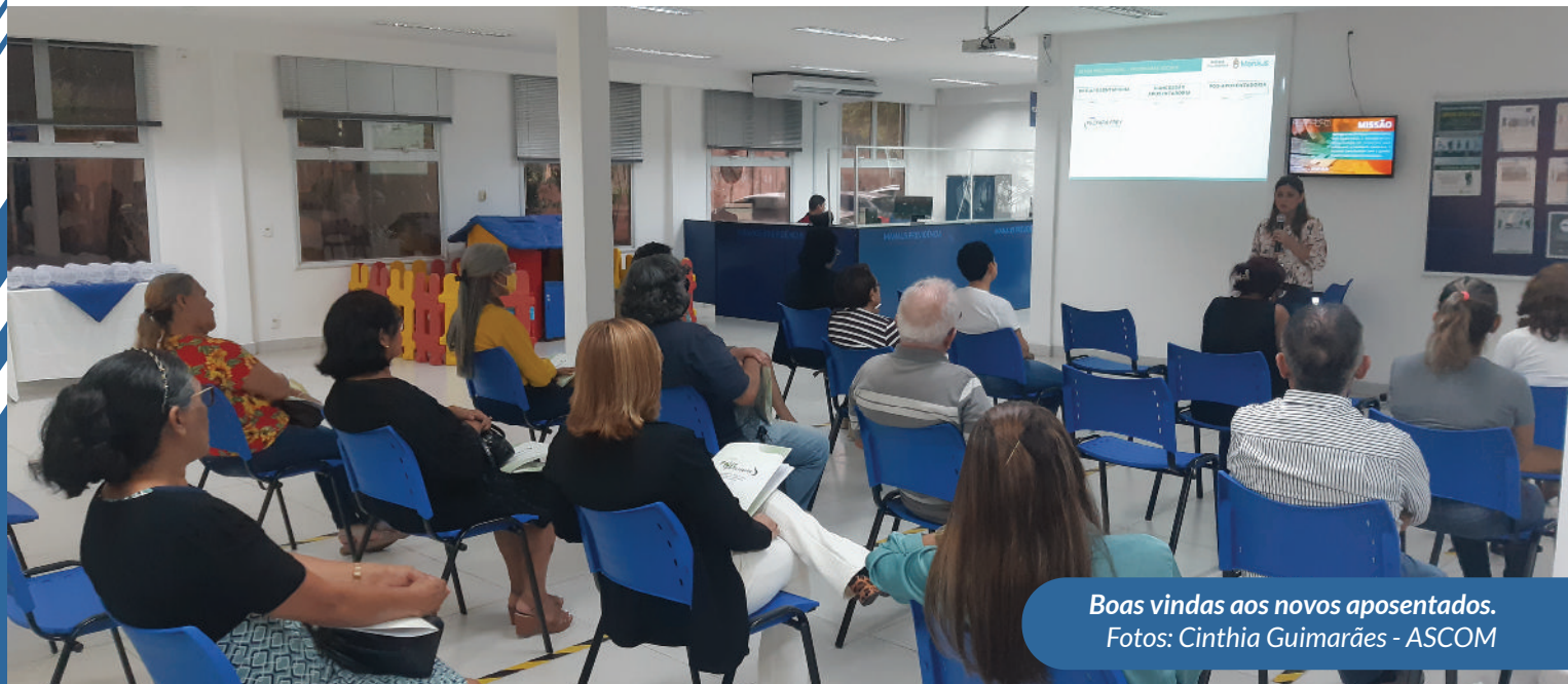
Boas vindas aos novos aposentados.

A Manaus Previdência homenageou os novos aposentados municipais do 1º trimestre de 2022, no dia 29 de abril, com o retorno do programa “Feliz Vida Nova” de forma presencial. O evento estava suspenso há dois anos, devido à crise sanitária da Covid-19, por isso, o acolhimento era realizado de forma virtual. Agora, o Feliz Vida Nova retoma os encontros por conta do alto índice de vacinação na cidade.